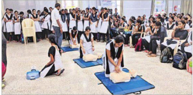
హార్ట్ లటాక్ కు గురైన వారికి ప్రథమ చికిత్స ఎలా చేయాలో విద్యార్థులకు శిక్షణ