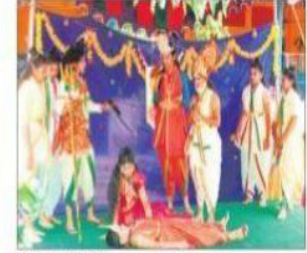
పోరంకిలో వినాయకచవితి పండుగను ప్రదర్శిస్తున్న విద్యార్థులు

పండుగను ప్రకృతి సిద్ధంగా చేసుకోవాలన్నారు. అందుకే విద్యార్థులకు పర్యావరణంపై అవగాహన కల్పించడానికి మట్టి వినాయకుడి విగ్రహాలు తయారీపై ప్రేరేపించామని వివరించారు. దాదాపు 50 మంది విద్యార్థులు పాల్గొని వినాయక విగ్రహాలు తయారు చేశారన్నారు. ఈ కార్యక్రమంలో ఉపాధ్యాయులు, విద్యార్థులు