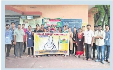
సామాజిక సర్వే చేపడుతున్న వీఆర్ సిద్ధార్థ కళాశాల విద్యార్థుల బృందం

సెరవేరుస్తూ సమస్యలను పరిష్కరించే మార్గాలను వెతుకుతున్న ఈ విద్యార్థులు అందరి ప్రశంసలు పొందుతున్నారు. 7 బృందాలు.. 125 మంది విద్యార్థులు వెనుకబడి ఉన్న గ్రామీణ ప్రాంతాల అభివృద్ధిలో ఉన్నత విద్యనభ్యసించే యువతను భాగస్వాములను చేసి.. వారి ద్వారా సమస్యలను గుర్తించి పరిష్కార మార్గాలను కనుగొనేందుకు ఉన్నత భారత్ అభియాన్ ఈ సర్వేను చేపట్టింది. ఇందులో భాగంగా ఉన్నత భారత్ అభియాన్ ద్వారా ఇంటింటికీ వెళ్లి వారు సగంరోజున వీఆర్ సిద్ధార్థ, కేటీఎస్ కళాశాలకు ఈ అవకాశాన్ని ఇచ్చారు. వీఆర్ సిద్ధార్థలోని 7 విభాగాలకు చెందిన 125 మంది విద్యార్థులు 7 బృందాలుగా ఏర్పడి మార్చి నుంచి సర్వే ప్రారంభించారు. శని, ఆదివారాల్లో ఈ సర్వే జరుగుతుంది. పెనుమలూరు నియోజకవర్గంలోని కానూరు, సివీల్, ఎలక్ట్రీకల్ విభాగాల బృందం. (కోడవరం (కంపూటర్ సైన్స్ బృందం),