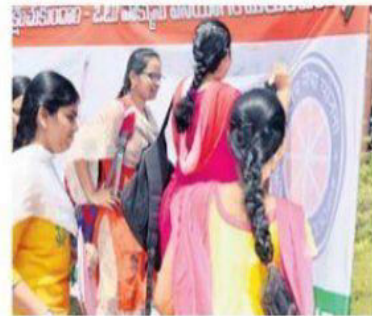
ఓటు వేస్తామని సంతకాలు చేస్తున్న విద్యార్థినులు