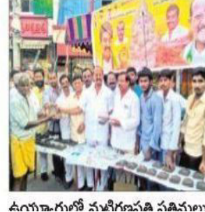
ఉయ్యూరులో నవధాన్యాలతో వినాయకుని