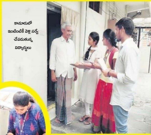
కానూరులో ఇంటింటికీ వెళ్లి సర్వే చేపడుతున్న విద్యార్థులు

'అవ్వా.. మీకు నెలనెలా పంచనం అందుతోంది? తాళగారు.. మీ ఊర్లో రోడ్లన్నీ బాగున్నాయా? రాత్రిపూట బస్సులు, ఆటోలు వస్తున్నాయా? అన్నా.. మీ కుకూలు నుంచి తాగునీరు సక్రమంగా సరఫరా అవుతోందా? చెల్లీ.. మీకు ప్రతినెలా రేషన్ సరకులు అందుతున్నాయో..' అంటూ ఆప్యాయంగా పలకరిస్తూ, వ్యక్తిగత సమస్యలతోపాటు స్థానిక ఇబ్బందులను తెలుసుకునేందుకు కదిలింది యువసైన్యం. సైనికులై సామాజిక సర్వేను చేపట్టారు వీఆర్ సిద్ధార్థ ఇంజనీరింగ్ కళాశాల విద్యార్థులు. కేంద్ర ప్రభుత్వ ఉన్నత భారత్ అభియాన్ సూచనల మేరకు కళాశాలకు చెందిన 125 మంది విద్యార్థులు 7 బృందాలుగా ఏర్పడి గ్రామీణ ప్రాంతాల్లో ఈ సర్వేను చేపట్టి సమస్యలను ప్రభుత్వం దృష్టికి తీసుకెళ్తున్నారు.