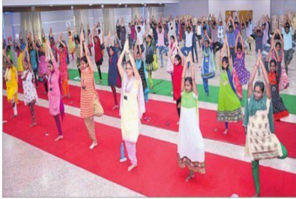
సిద్ధార్థ ఇంజనీరింగ్ కాలేజీలో యోగ చేస్తున్న విద్యార్థినులు