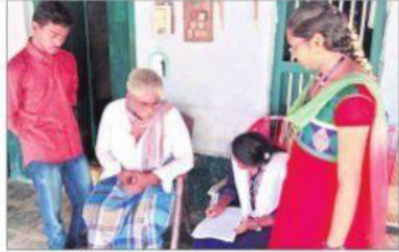
గ్రామంలో స్థానికుల నుంచి వివరాలు తెలుసుకుంటున్న ఎన్ఎస్ఎస్ విద్యార్థులు

పమిడిముక్కల : మండలంలోని అమీనపురంలో మంగళవారం విజయవాడ వెలగపూడి రామకృష్ణ సిద్ధార్థ ఇంజనీరింగ్ కళాశాల ఎన్ఎస్ఎస్ విద్యార్థులు ఉన్నత భారత్ అభియాన్ కార్యక్రమంలో భాగంగా సామాజిక సర్వే నిర్వహించారు. వాలంటీర్లు ఇంటింటికీ వెళ్లి ప్రభుత్వ పథకాలు, ఇతర ప్రాంతాలకు వలస వెళ్లిన వారి సంఖ్య, తాగునీరు, పారిశుద్ధ్యం, పశువులు, వ్యవసాయం, విద్యుత్ వివరాలు అడిగి తెలుసుకొన్నారు. గ్రామంలో కనీస వసతులు, మౌలిక సదుపాయాల వివరాల తెలుసుకొన్నారు. కేంద్ర, రాష్ట్ర ప్రభుత్వ పథకాలు అర్హులైన వారికి అందుతున్నదీ, లేనిదీ అనే అంశాలపై సర్వే చేపట్టారు. కార్యక్రమాన్ని ఎన్ఎస్ఎస్ ప్రోగ్రాం అధికారి