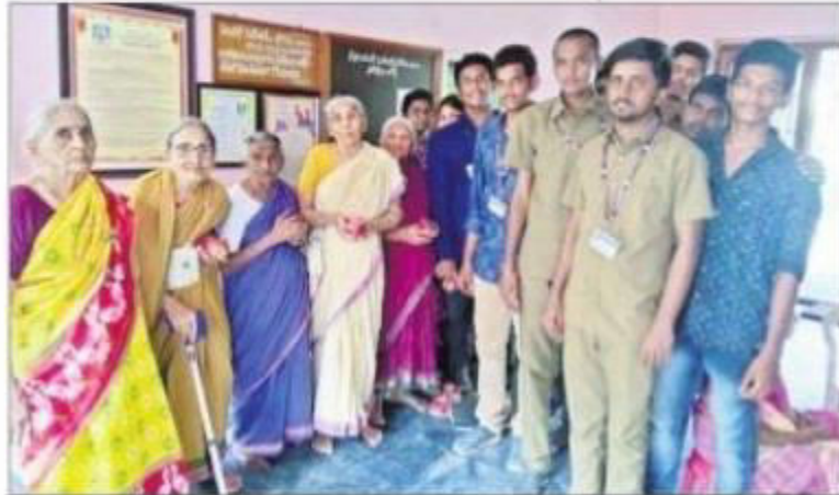
కానూరు వృద్ధుల ఆశ్రయంలో పండ్లు అందజేసిన విద్యార్థులు