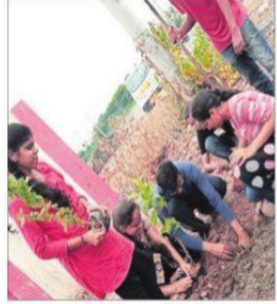
గుడి ఆవరణలో మొక్కలు నాటుతున్న విద్యార్థులు

నేయస్వామి ఆలయంలో ఇంజనీరింగ్ విద్యార్థులు ఆదివారం మొక్కలు నాటారు. కానూరు వీఆర్ సిద్ధార్థ ఇంజనీరింగ్ కాలేజీ ఎస్ఐఎస్ఎస్ వలంటీర్లు ఆలయం వద్ద స్వచ్ఛాభారత్ కార్యక్రమం నిర్వహించారు. తొలుత ఆలయ పరిసర ప్రాంతాల్లో పిచ్చి మొక్కలు తొలగించారు. అనంతరం ఆలయ ఆవరణలో మొక్కలు నాటారు.