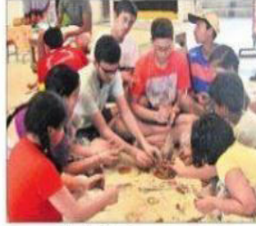
వినాయకుడి ప్రతిమలు తయారు చేస్తున్న విద్యార్థులు