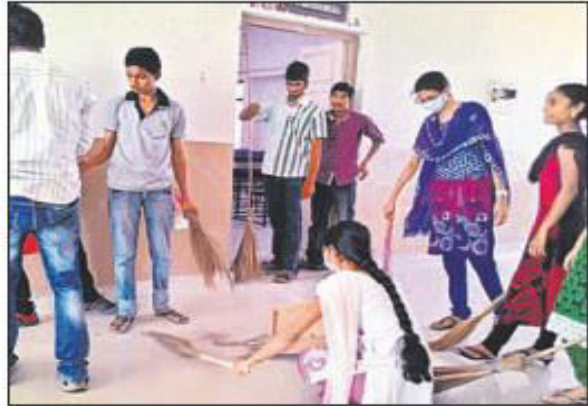
తరగతి గదులు శుభ్రం చేస్తున్న విద్యార్థులు