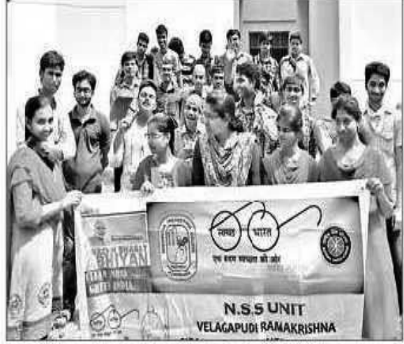
స్వచ్ఛభారత్లో పాల్గొన్న విద్యార్థిని, విద్యార్థులు