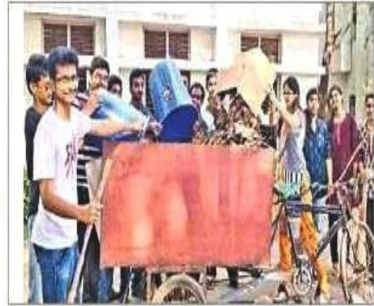
చెత్తను తొలగిస్తున్న విద్యార్థులు